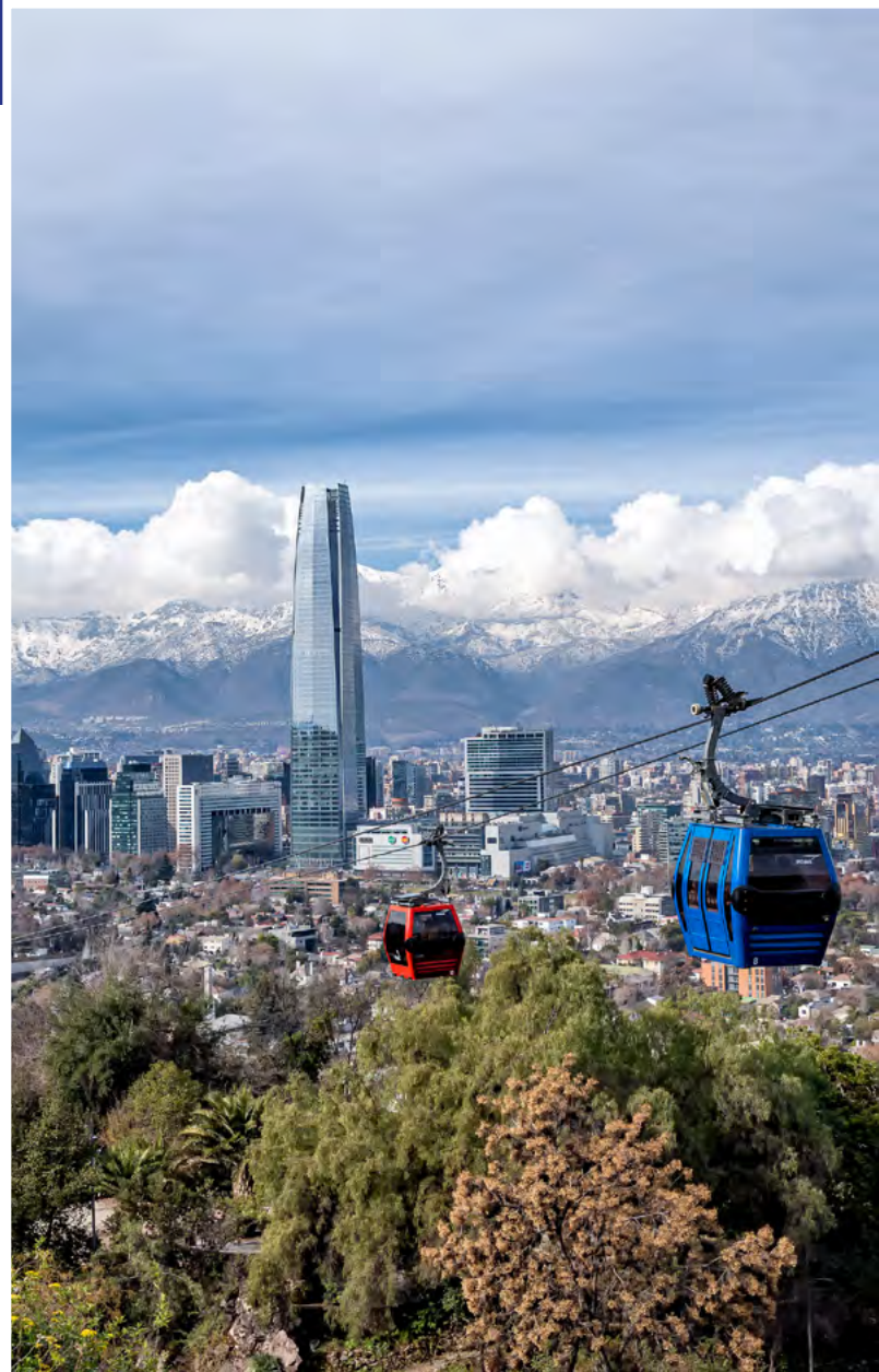
↑ Teleférico de Santiago, Cerro San Cristóbal

En los alrededores de Santiago se ubican varios de los valles vitivinícolas más importantes del país, que son conocidos por su Ruta del Vino , donde pueden visitarse diversos viñedos.