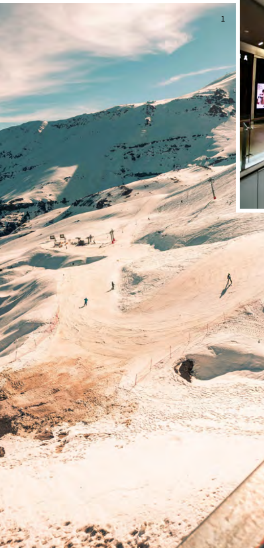
↑ Valle Nevado