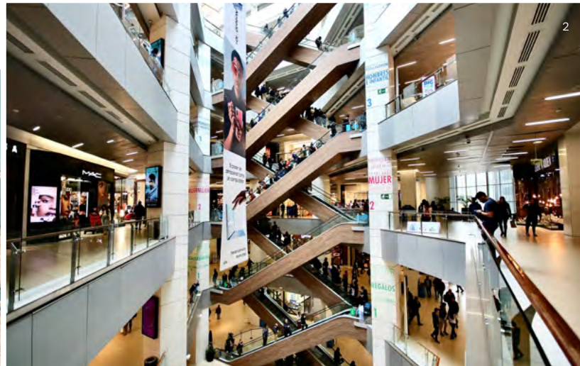
← Costanera Center