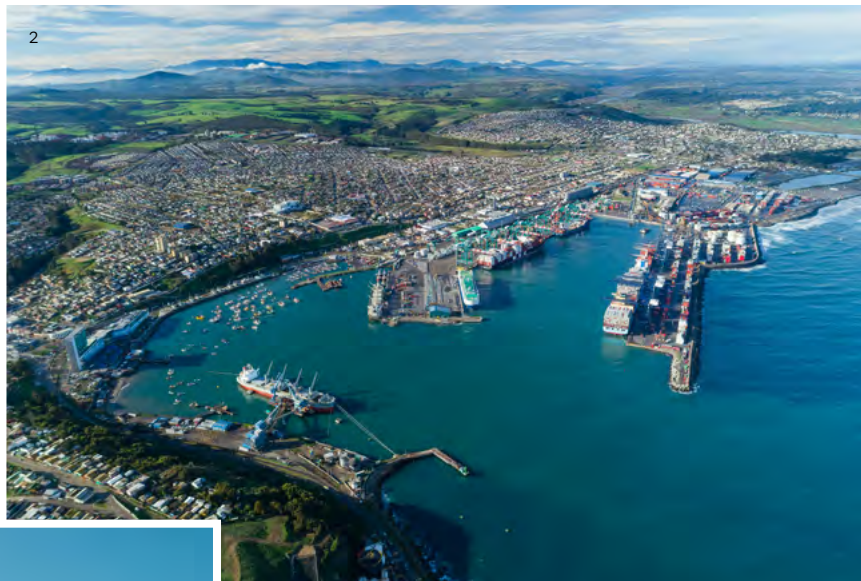
↑ San Antonio