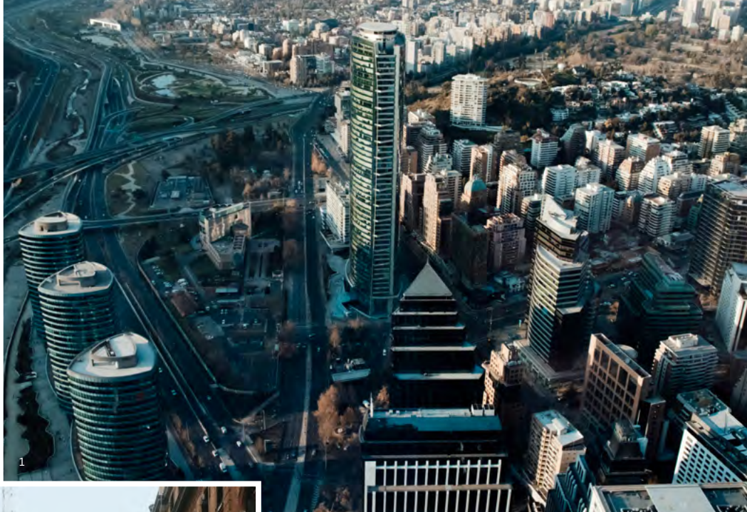
↑ Santiago de Chile