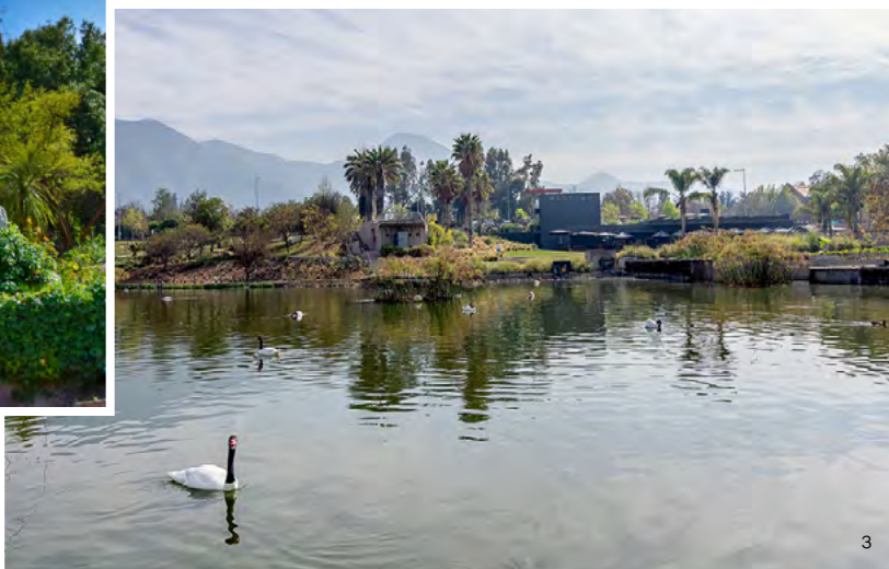
↓ Parque Bicentenario