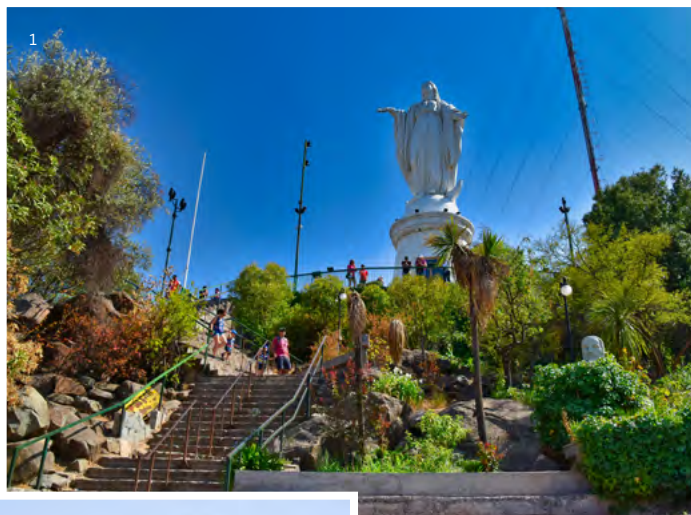
← Cerro San Cristóbal