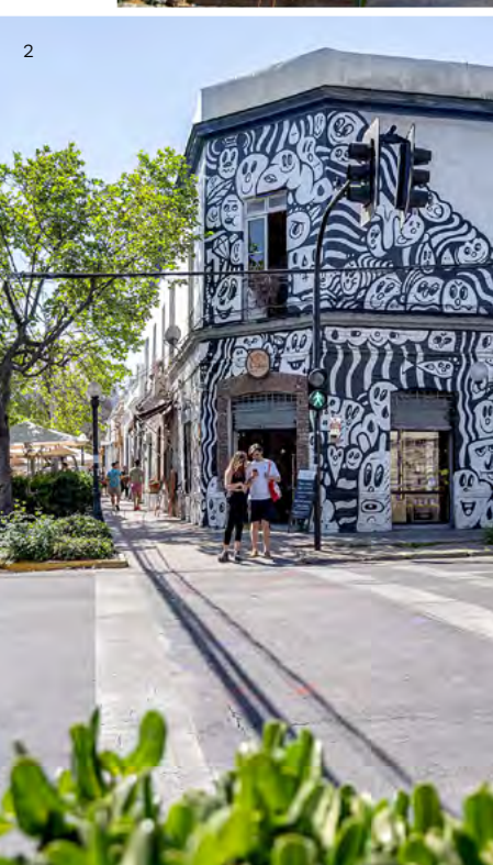
↑ Barrio Italia