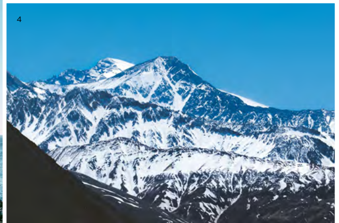
↑ Cajón del Maipo