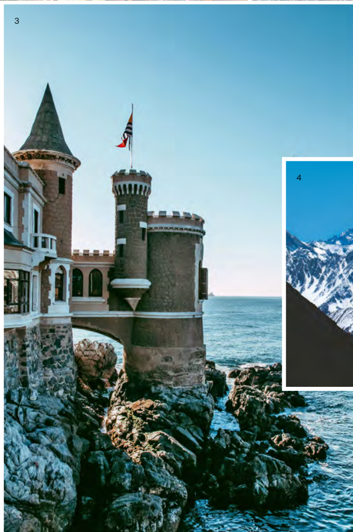
↑ Viña del Mar